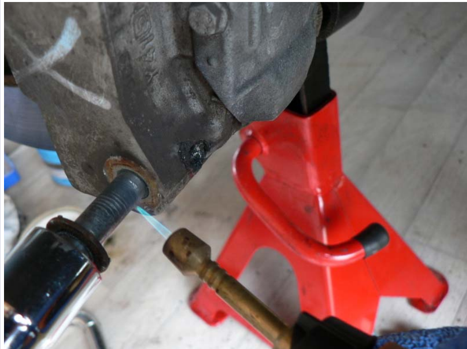
c'est à partir de là que l'on voit la différence entre les étriers