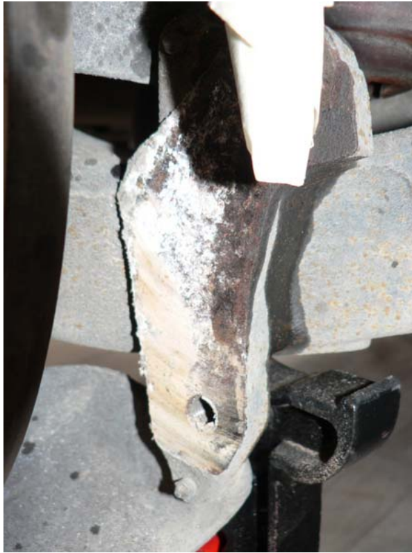
idem pour le bras de suspension un petit coup de toile émeri et le support retrouve un aspect plus convenable