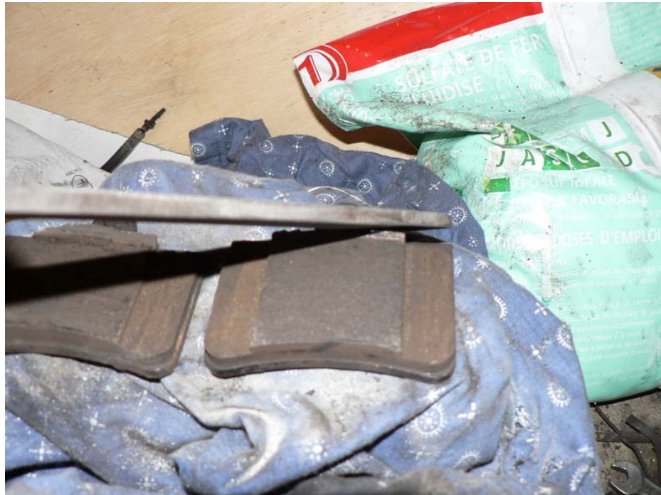
on en profite pour chanfreiner les plaquettes on voit ici qu'elles ne sont pas usées correctement, signe que le haut de la plaquette n'appuie pas sur le disque