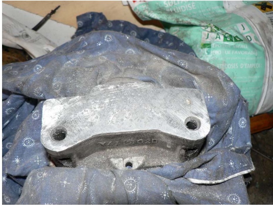
voilà qui est mieux