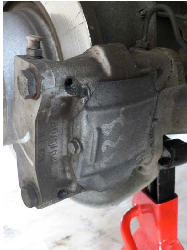
2 gros goujons à dévisser